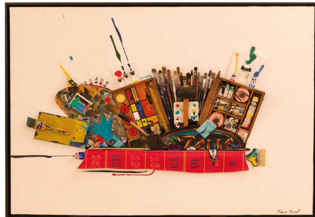
L'ATELIER DE ZEUS, 2018 TECHNIQUE MIXTE SUR TOILE MAROULÉE SUR BOIS 89 x 130 x 4 cm