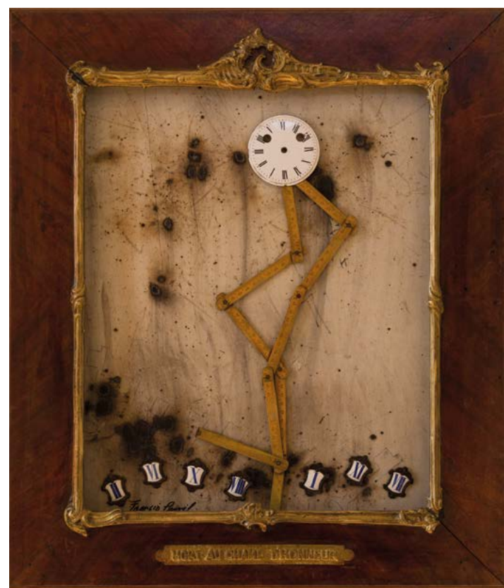
TEMPS MORT, 2021 TECHNIQUE MIXTE SUR BOIS 65 x 57 cm