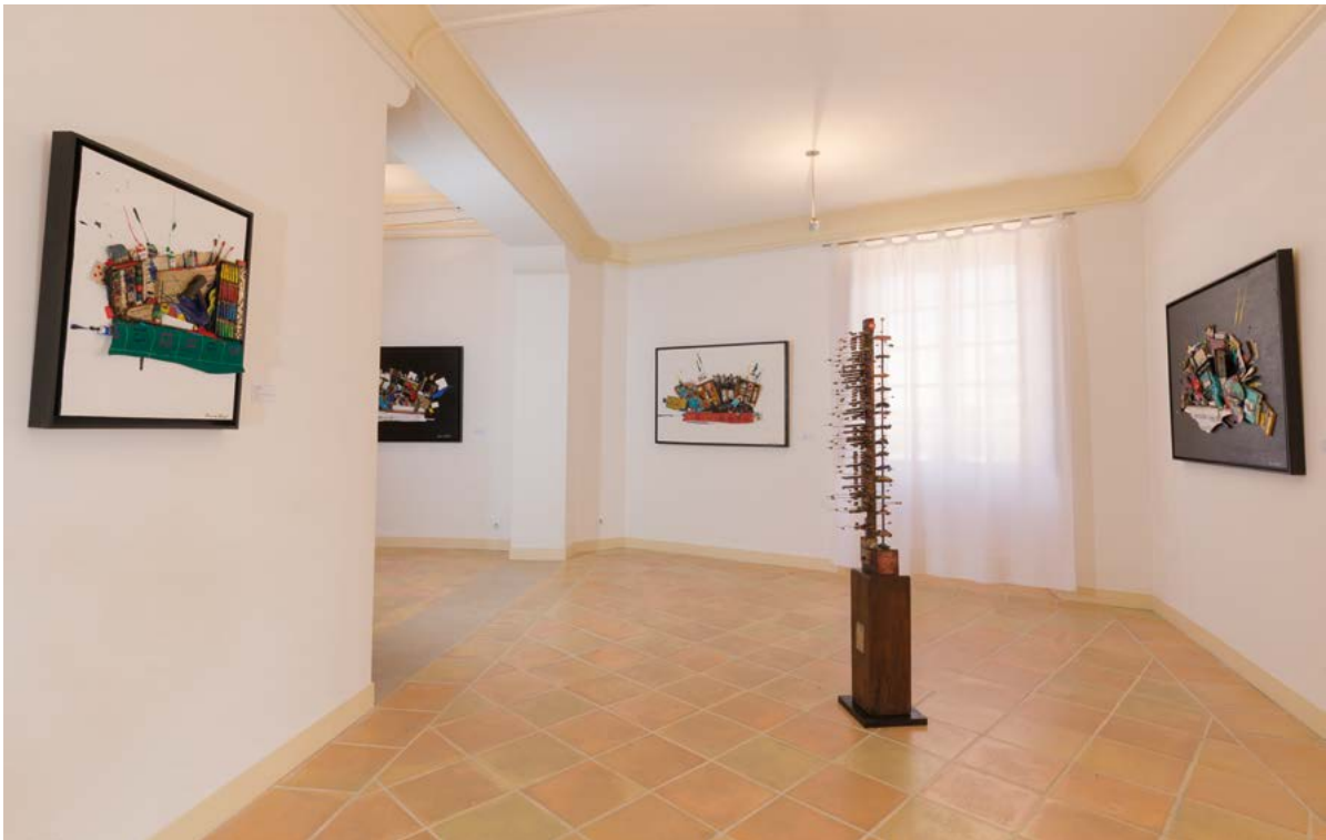
ENTRÉE DE L'EXPOSITION AVEC LA SCULPTURE «UN AMÉRICAIN À PARIS», 2020 ET VUE PARTIELLE DE L'ATELIER