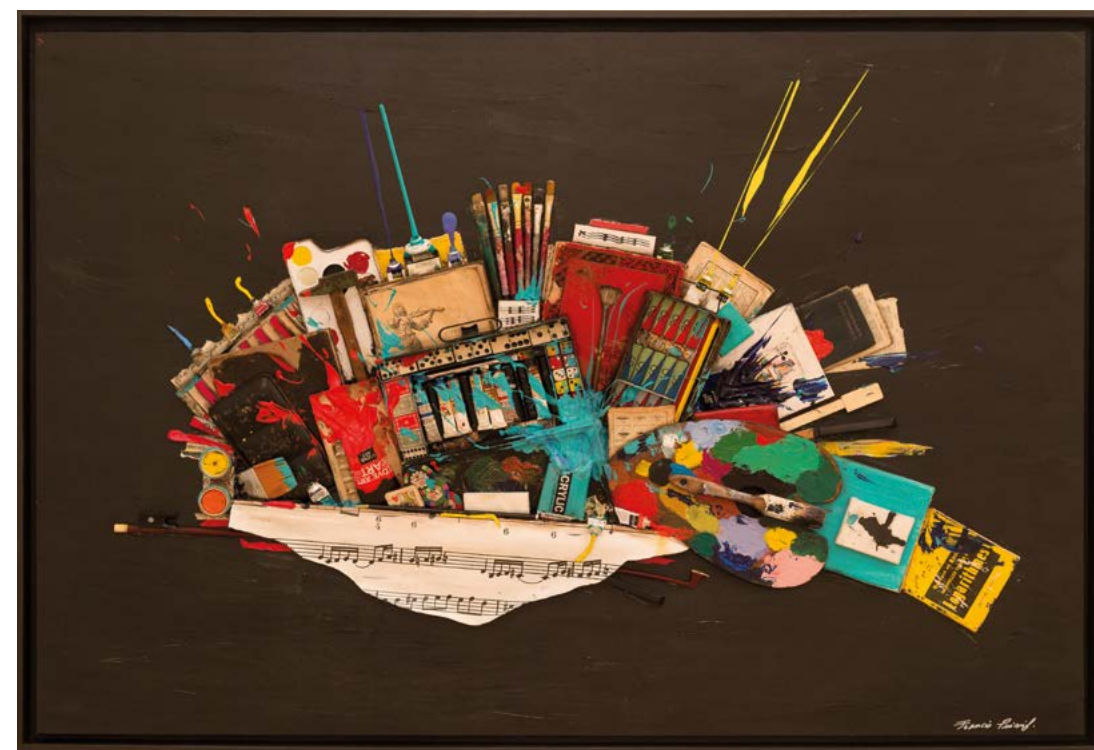
ODYSSÉE NOCTURNE, 2021 TECHNIQUE MIXTE SUR TOILE MAROULÉE SUR BOIS 89 x 130 x 4 cm