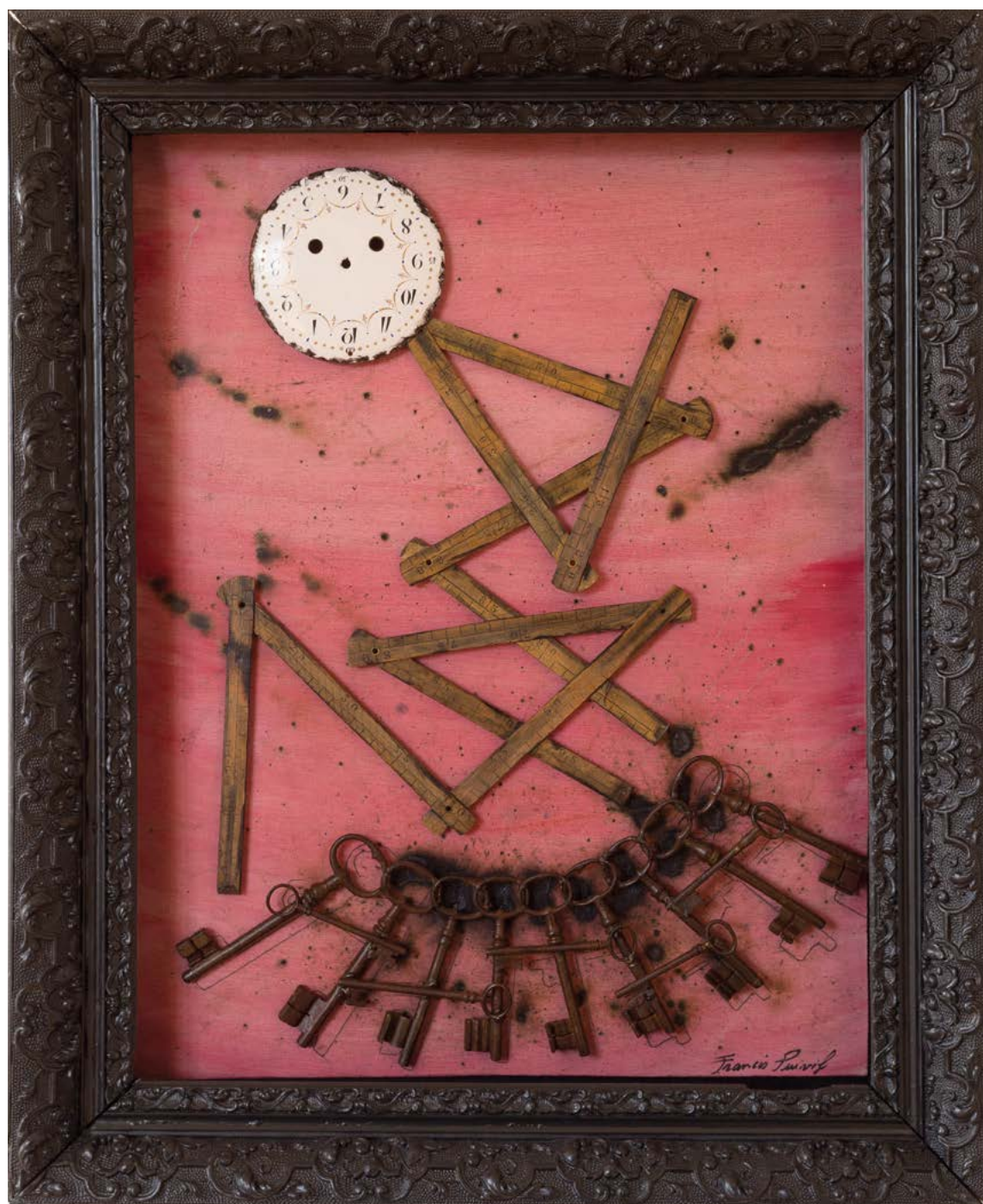
LA FILEUSE 2021 TECHNIQUE MIXTE SUR BOIS 80 x 65 cm