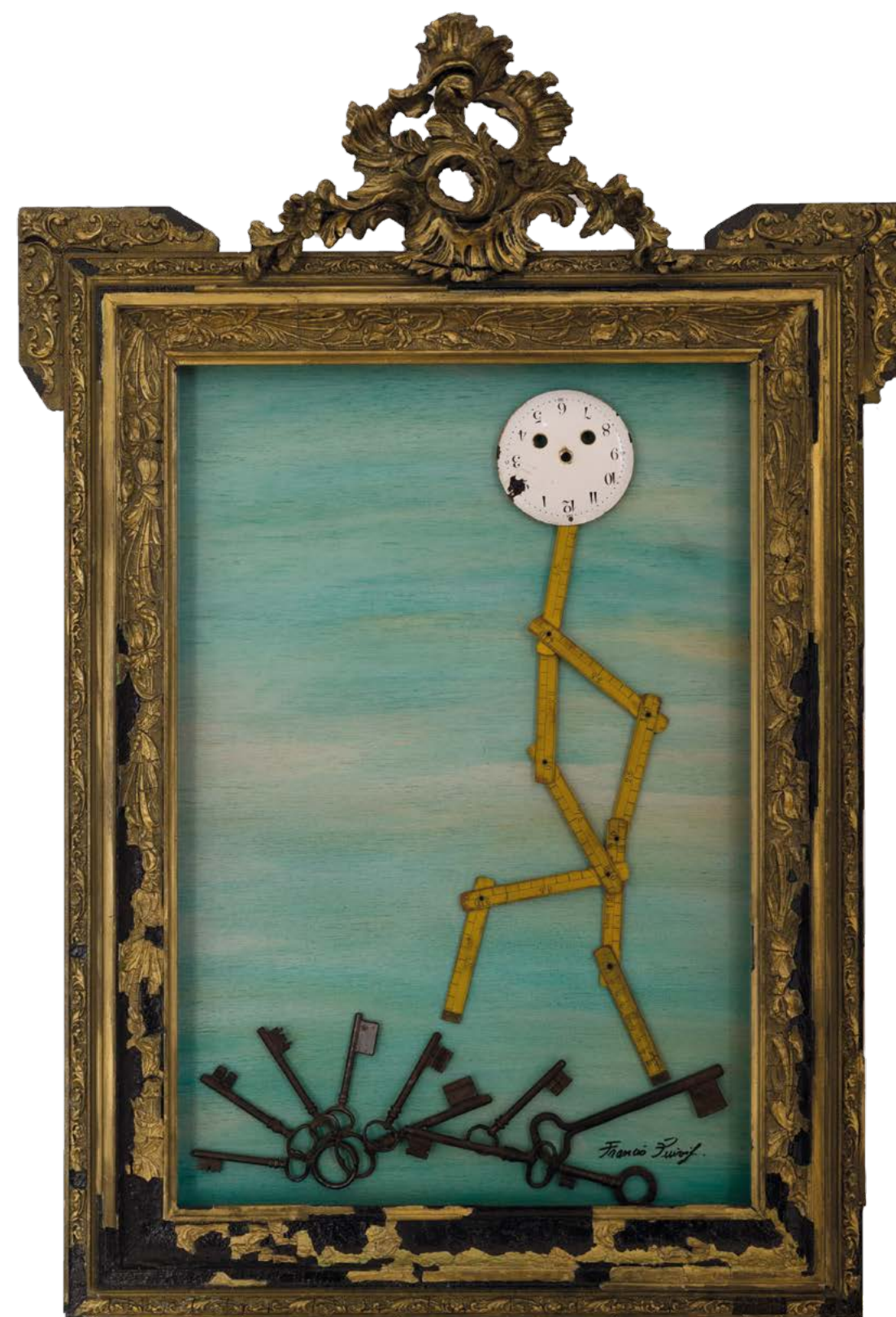
LE GRAND HORLOGER, 2020 TECHNIQUE MIXTE SUR BOIS, 100 x 64 cm