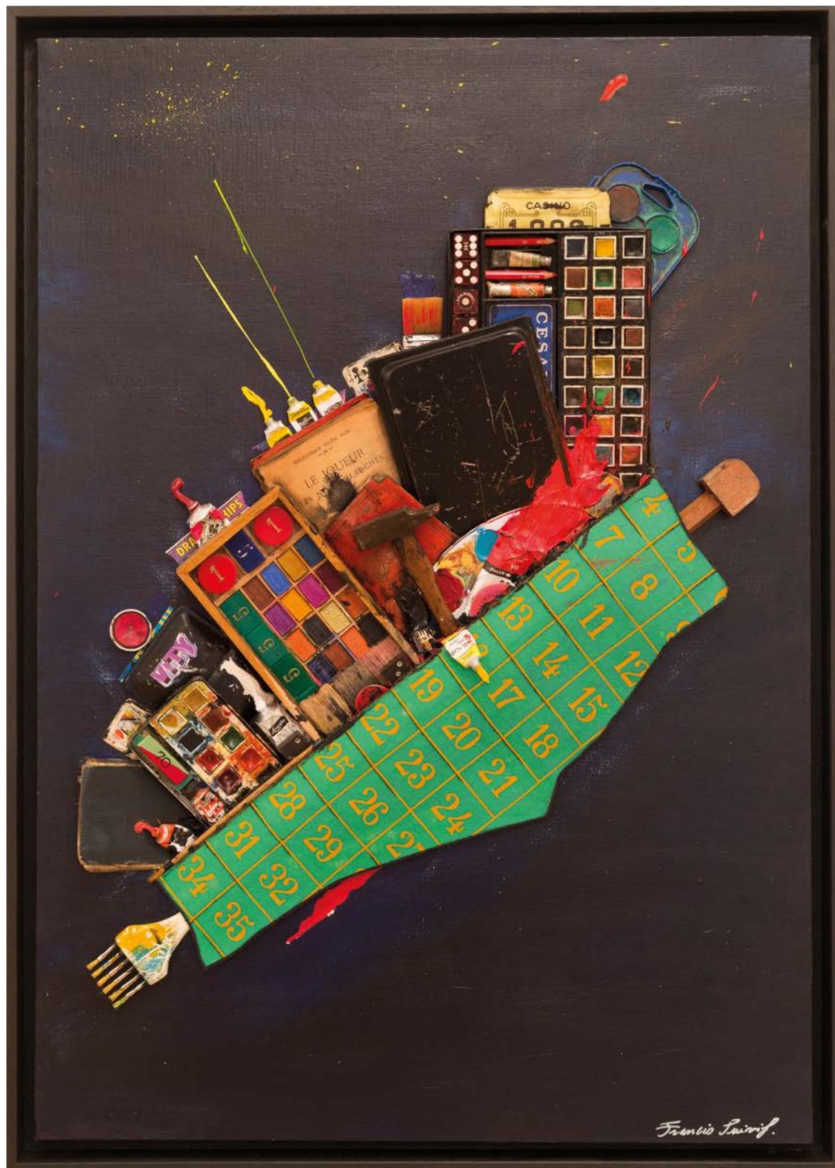
NUIT BLANCHE, 2020 TECHNIQUE MIXTE SUR TOILE MAROULÉE SUR BOIS 90 x 72 x 4 cm