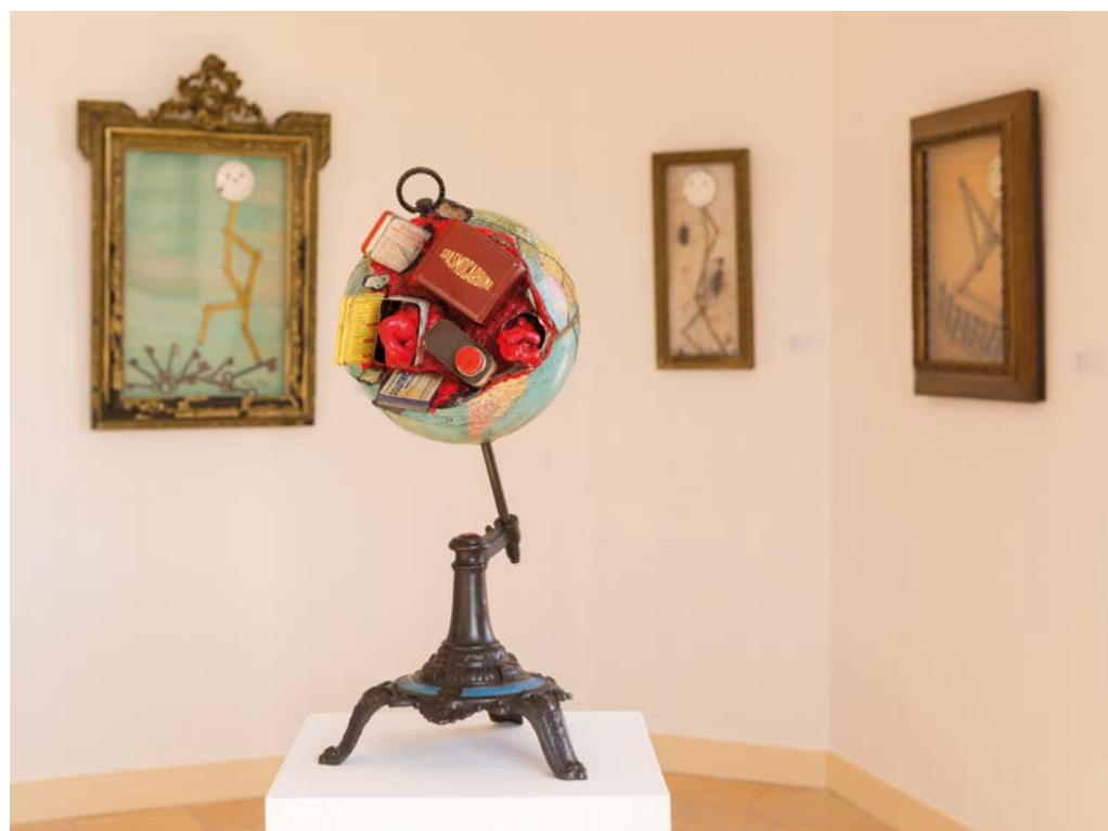
SOLUTRICINE, 2019 ASSEMBLAGE