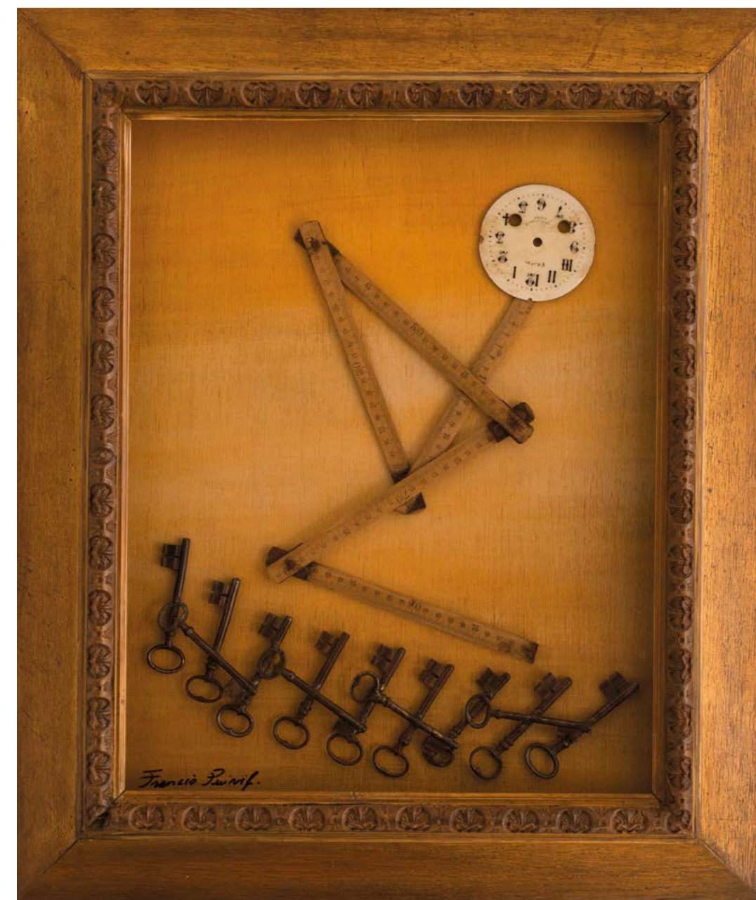
ATTRAPE TEMPS 2021 TECHNIQUE MIXTE SUR BOIS 65 x 50 cm