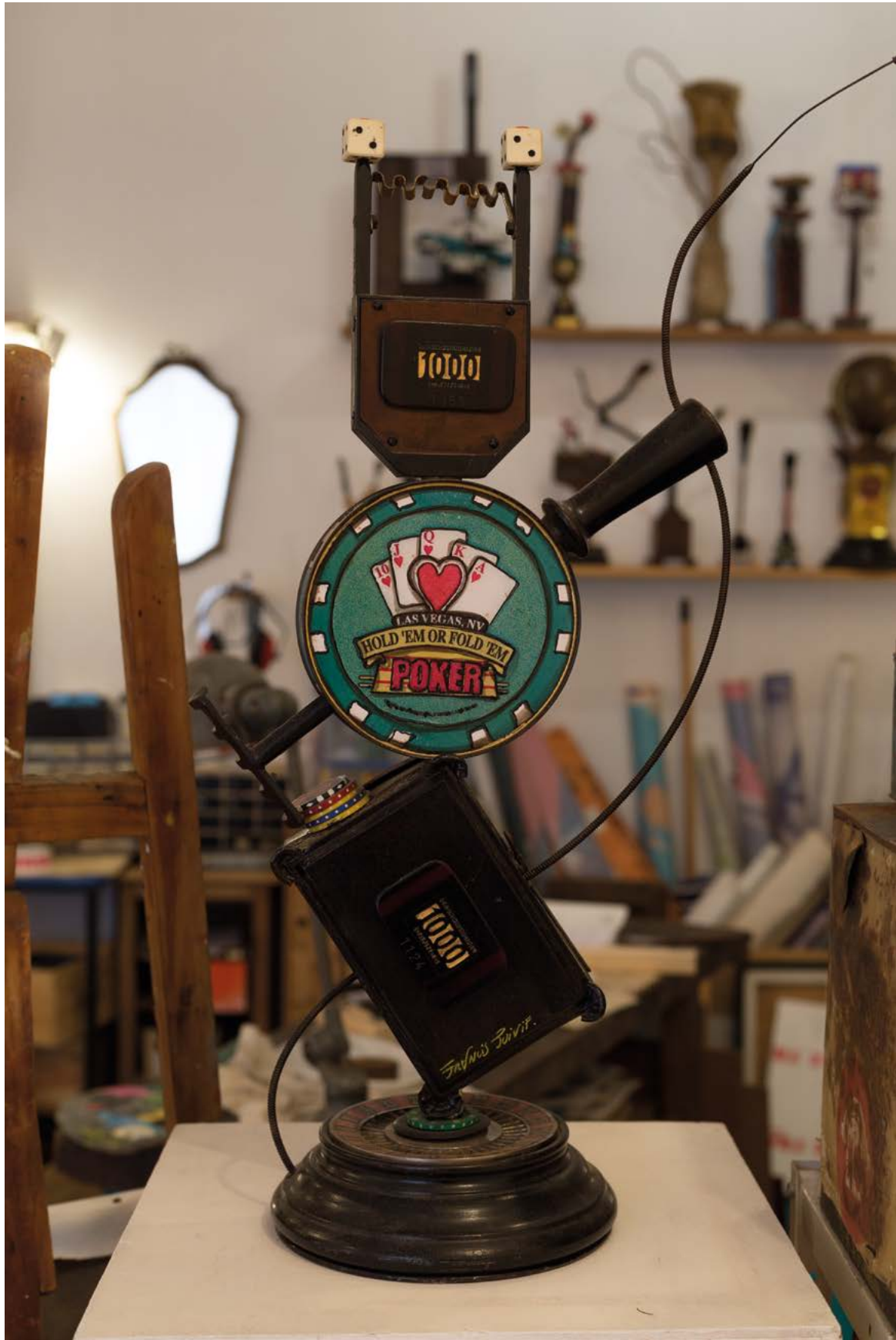
ATELIER DÉTAILS, 2022