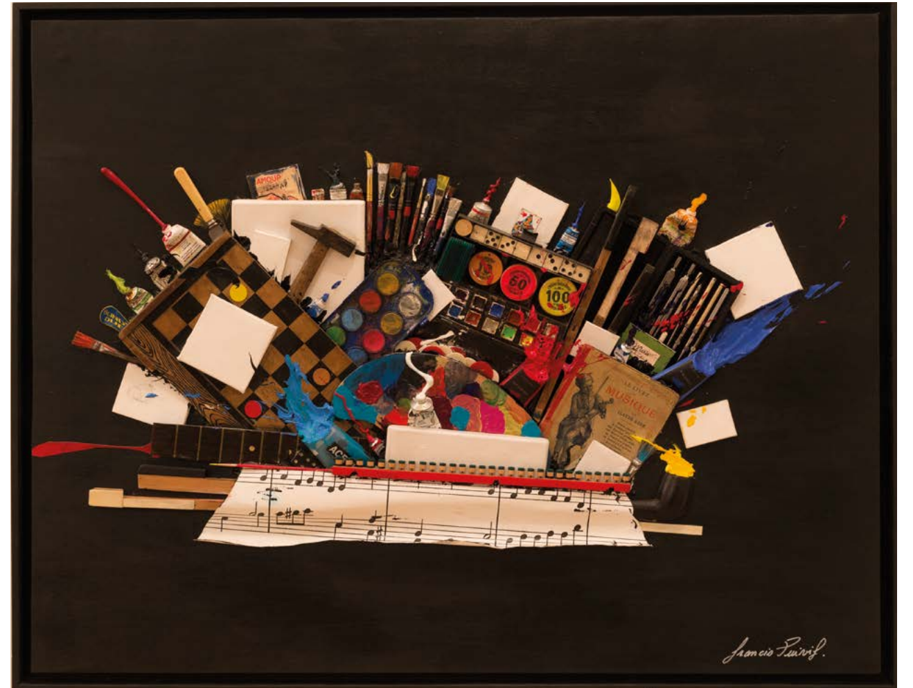
VOLO DE NOTTE 2019 TECHNIQUE MIXTE SUR TOILE MAROUFLÉE SUR BOIS 89 x 116 x 4 CM