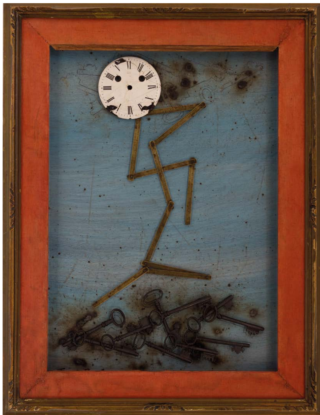
TEMPS DANSE 2020 TECHNIQUE MIXTE SUR BOIS 75 x 58 CM