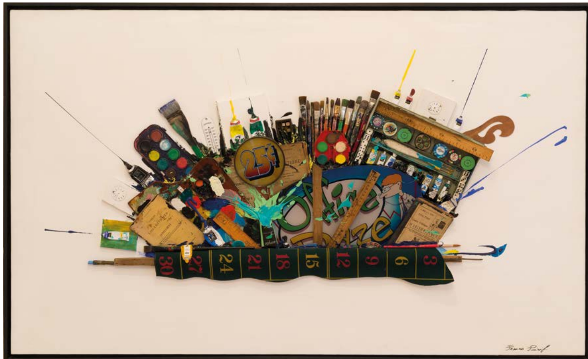
TABLE DES MATIÈRES, 2020 TECHNIQUE MIXTE SUR TOILE MAROUFLÉE SUR BOIS 92 x 160 x 4 CM