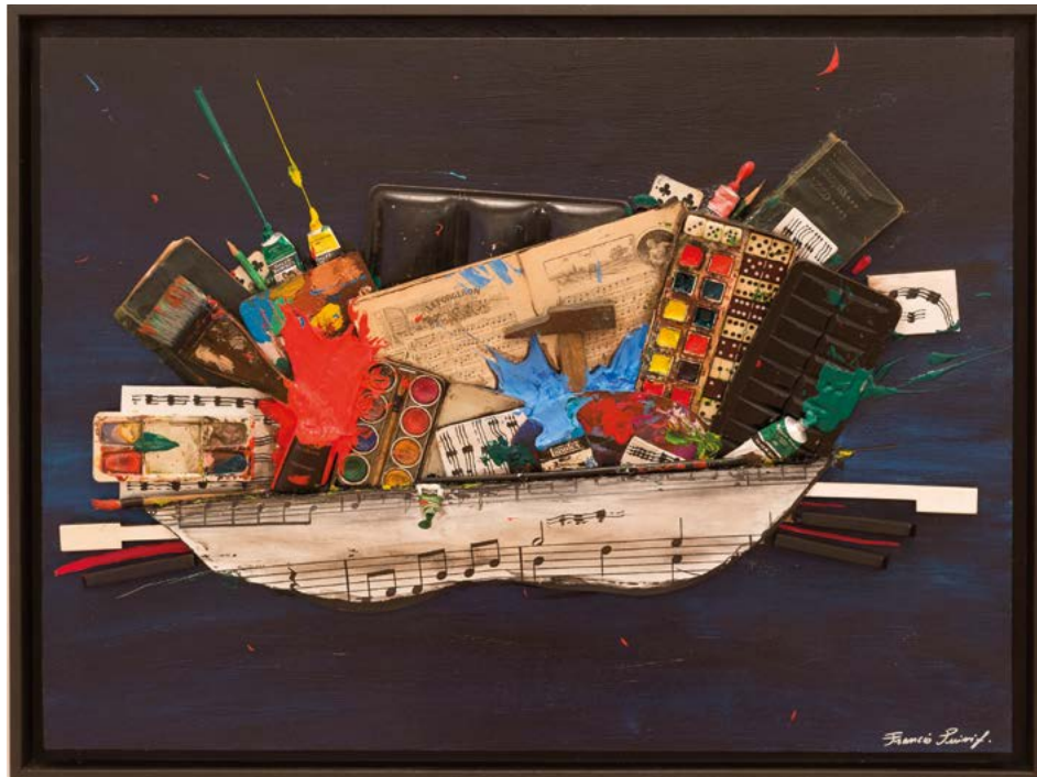
ODYSSÉE MUSICALE, 2021 TECHNIQUE MIXTE SUR TOILE MAROUFLÉE SUR BOIS 65 x 86 x 4 CM