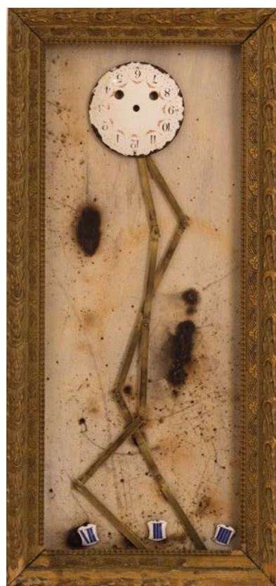
ENTRE TEMPS, 2020 TECHNIQUE MIXTE SUR BOIS 63 x 31 cm