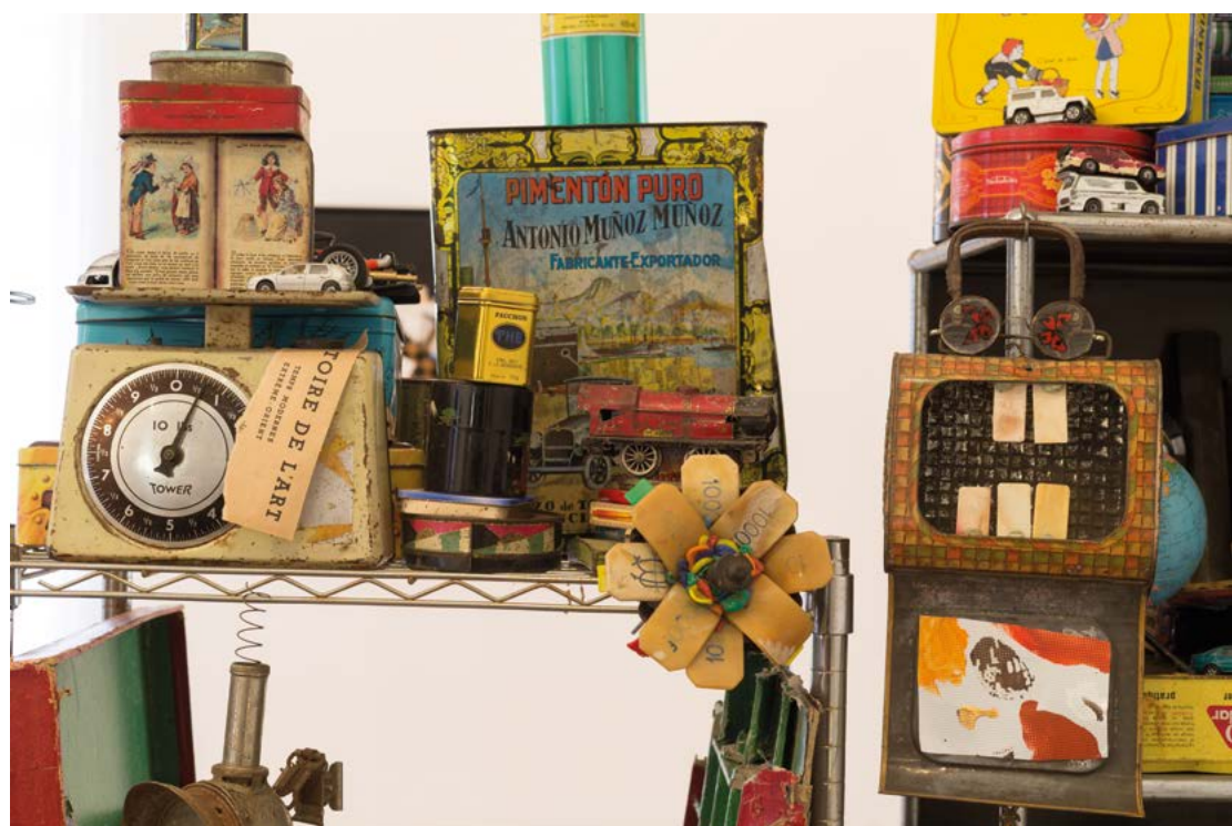
ATELIER DÉTAILS, 2022