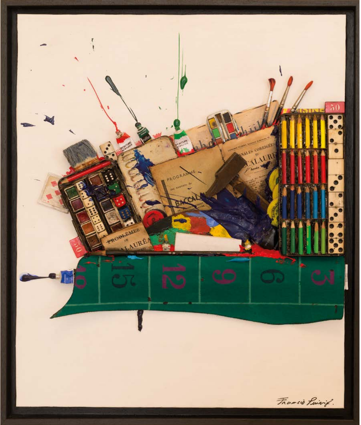
BAC MIC MAC 2021 TECHNIQUE MIXTE SUR TOILE MAROUFLÉE SUR BOIS 61 x 50 x 4 CM